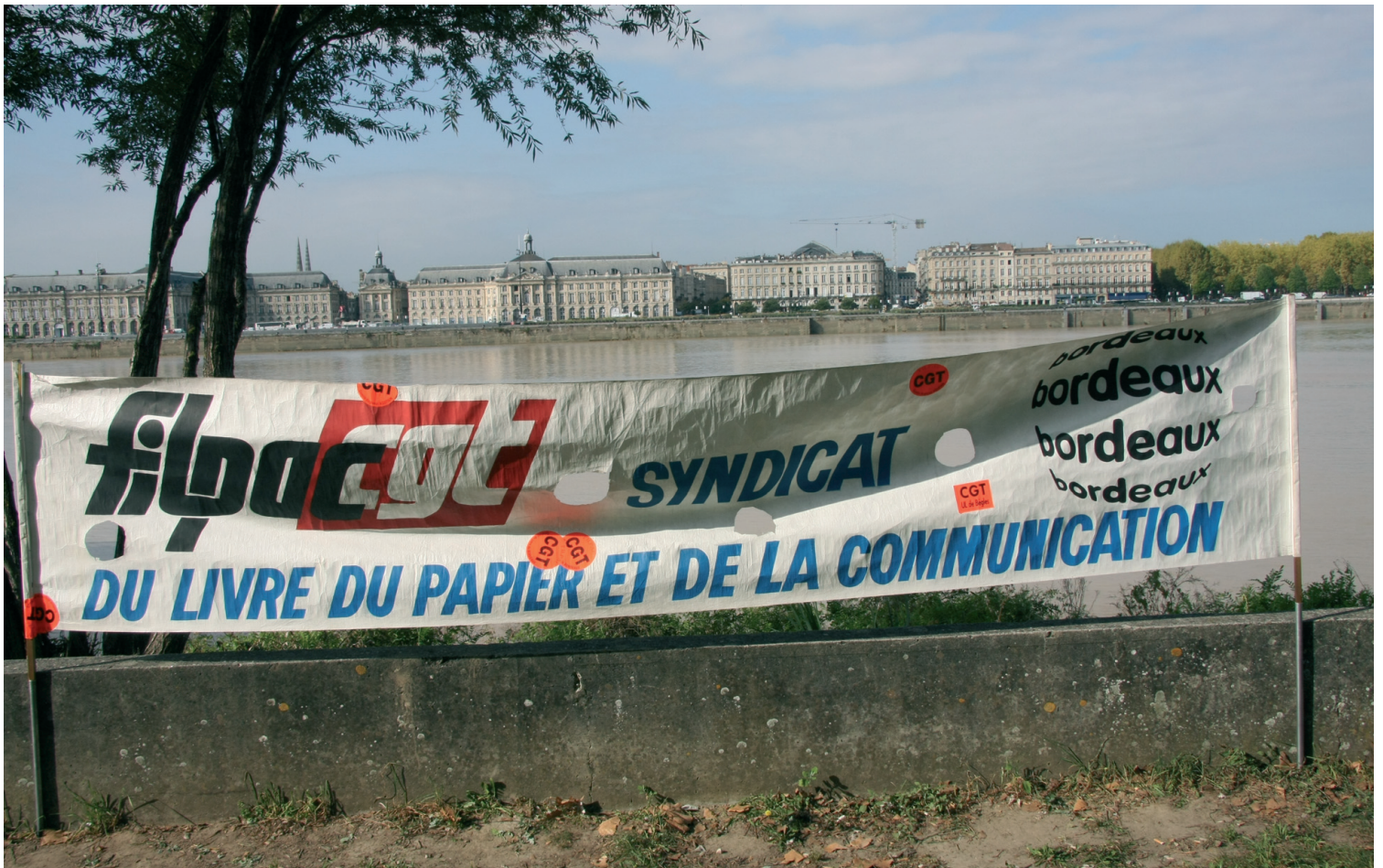
Banderoles de la Filpac-CGT lors d'un rassemblement à Bordeaux en 2011.