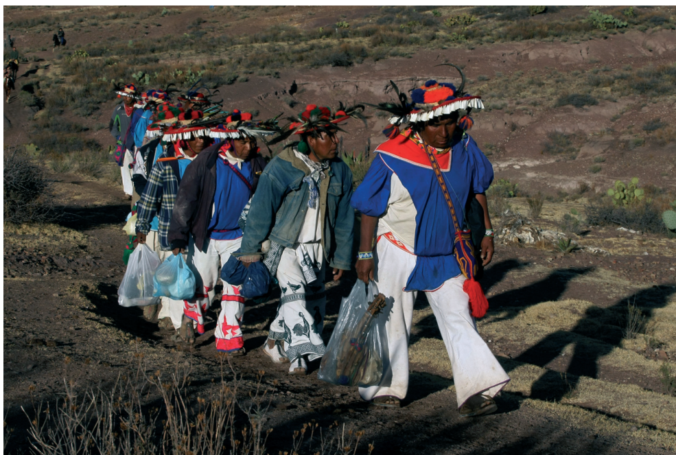
Indiens wixarika sur la terre de Wirikuta.

Le territoire de Wirikuta s'étend sur 140 212 hectares, dont 98 000 hectares ont été donnés en concession à des entreprises